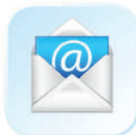
Электронная почта (E-mail)