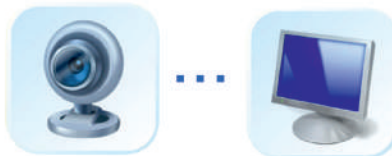
Web - камера (Skype)