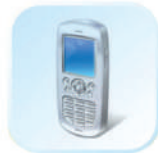
Мобильный телефон (SMS)