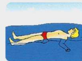
Лежа на спине