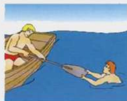
Весло или шест